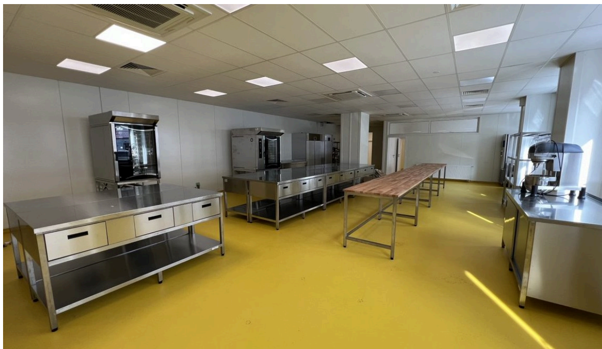
budova praktického vyučovania Na pántoch 20